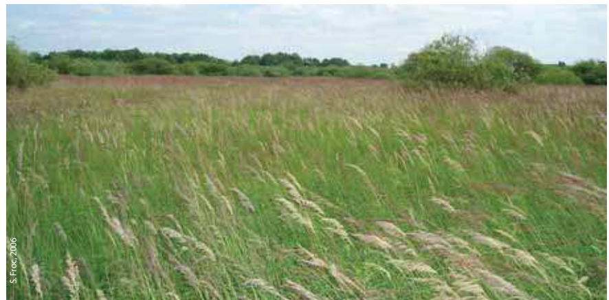
La calamagrostiaie traduit l'assèchement prolongé de la tourbière

L'abandon des pratiques agropastorales traditionnelles combiné à l'exploitation de la tourbe ont eu de graves conséquences sur le fonctionnement du milieu, et sont à l'origine de la perte de biodiversité observée sur le marais.