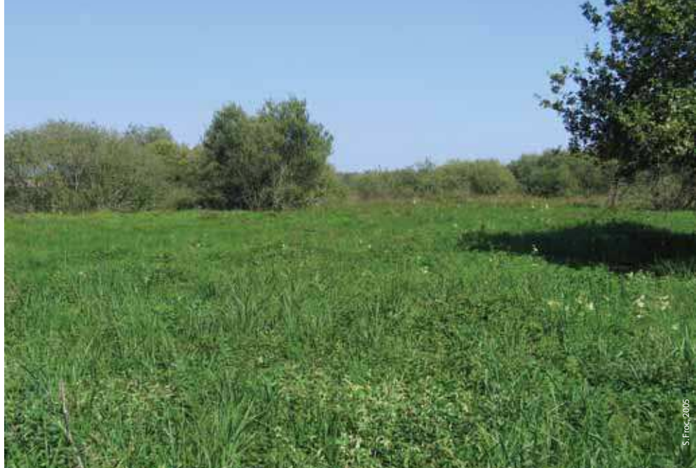
Vue générale du marais de Germont-Buzancy

important pour la tourbière, assèchant le marais et permettant l'installation de plantes nitrophiles.