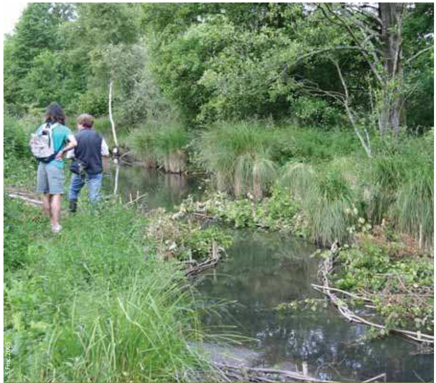
Fascines sur la rivière de la Bar

FROC S., RIVEZ S., 2003 - Marais de Germont-Buzancy (Ardennes) : Document d'objectif du site Natura 2000 n°42. Document de synthèse. Conservatoire du patrimoine naturel de Champagne-Ardenne. 66 p. + annexes.