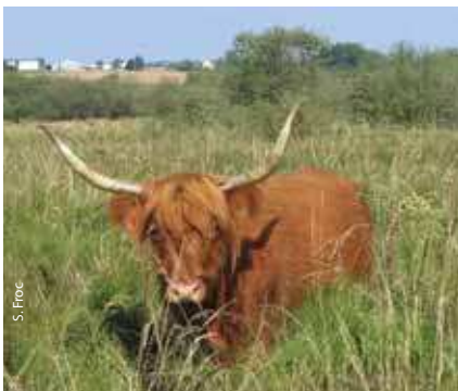
Highland Cattle pâturant dans la Zone de Protection Ecologique

Les curages de la Bar à outrance depuis les années 70 lui ont conféré un rôle de drain