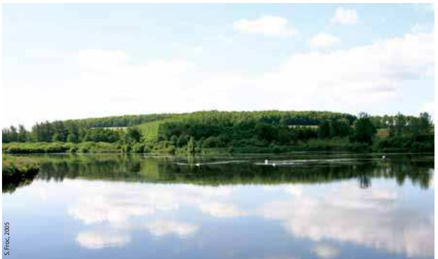
Fosse de tourbage en eau la grande taille du bassin induit des phénomènes de batillage qui détruisent les berges

problématique en raison du fort battement de la nappe, non maîtrisable, et donc de l'assèchement de la tourbe et de l'eutrophisation inévitables • Un blocage administratif, véritable frein à la gestion du site