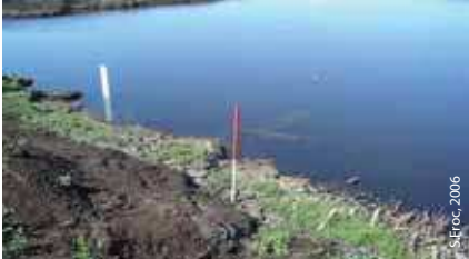
Remise en état des berges après exploitation : des pentes douces ont été créées

Les résultats sont satisfaisants (le lit s'est creusé par endroits, reprise de la végétation, etc.).