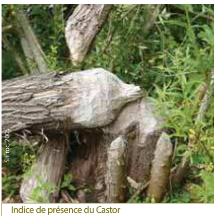
Indice de présence du Castor

Depuis les années 70, les marais de Germont-Buzancy font l'objet d'une exploitation de tourbe. L'ensemble des parcelles incluses dans le périmètre Natura 2000 est soumis à autorisation d'extraction.