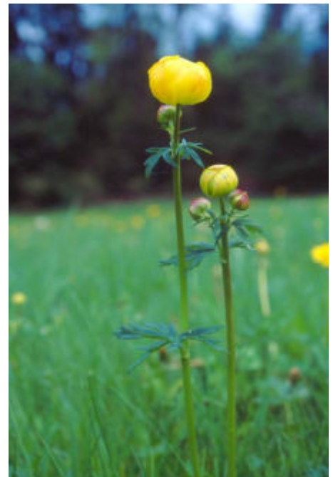
Trollé- Pascal Collin, Espace Naturel Comtois