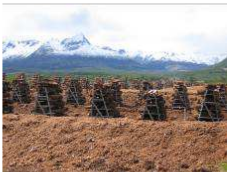
Tourbière en cours d'exploitation près d'Ushuaia, Terre de Feu, photo F. Muller

L'analyse pollinique d'une tourbière datant de l'Holocène, située dans la vallée d'Andorra, Terre de Feu, a permis d'établir pour cette période les variations du climat et du type de végétation. Les analyses montrent qu'à partir de 9500 av J.C. dominait un paysage de steppes relativement sec où l'on trouvait de rares arbres ( Nothofagus ). Cette période fut suivie d'un environnement, toujours de type « steppe », bénéficiant d'un climat sec et tempéré. A partir de 5000 av J.C, en raison de la diminution des températures et de l'augmentation de l'humidité, la forêt de hêtres austraux Nothofagus s'établit et les tourbières commencent à se former.