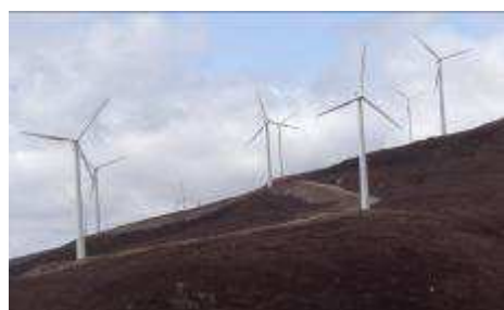
Eoliennes sur zone de tourbières de couverture en Galice, photo F. Muller.

Les notices ont été réalisées par Jonathan Meyer à l'occasion de son stage au Pôle-relais.