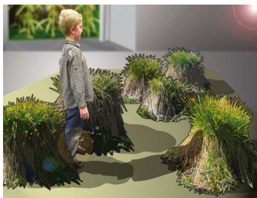
Ci-contre, une vision du muséographe du Pavillon des sciences, pour une possible représentation d'une partie de l'exposition.

Le projet d'exposition avec le Pavillon des sciences de Montbéliard, le Jardin botanique de Besançon et l'université de Franche-Comté se précise et les grands pôles de cette exposition se dessinent maintenant clairement.