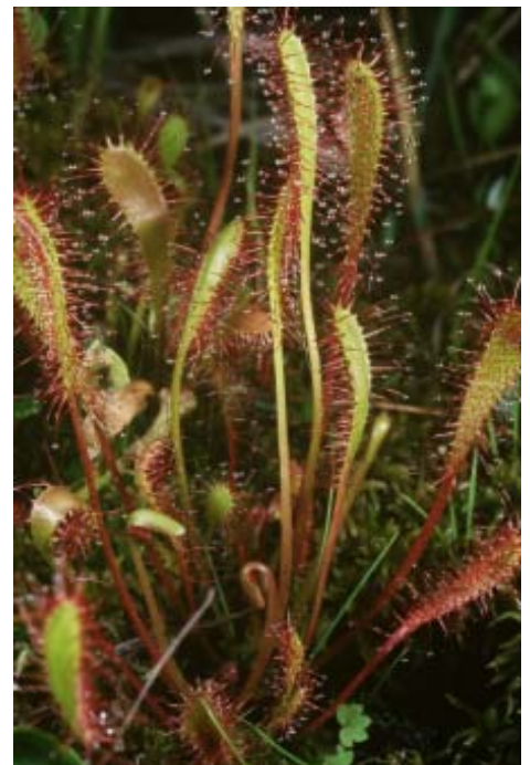
Nicolas Dupieux, Espaces Naturels de France

Tourbières-infos est diffusé uniquement par mail. Toute personne intéressée pour le recevoir doit s'inscrire à : Tourbieres-infos@pole-tourbieres.org