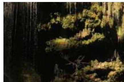
Des associations de mousses uniques sont présentes en têtes de bassins. Cascades de Baume-les-Messieurs [39].