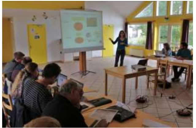
Rencontre scientifique franco-suisse à Frasne [25], le 11 octobre 2013.

42 personnes avaient répondu à notre invitation, ainsi qu'un groupe d'étudiants en protection de la nature. Nous avons aussi profité d'un événement orchestré au même moment par le PNR du Haut-Jura pour adjoindre des visites de sites en tourbières récemment restaurés à la Chaumusse et Fort-du-Plasne [39] (reméandrage d'un cours d'eau dans la traversée d'un bas-marais) et à Frasne [25] (nouvelle phase de la réhabilitation des tourbières du plateau).