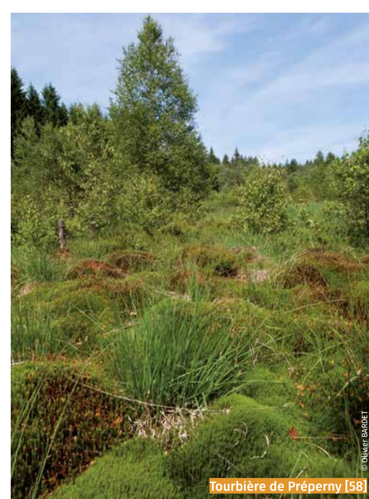
Tourbière de Prépéry [58]