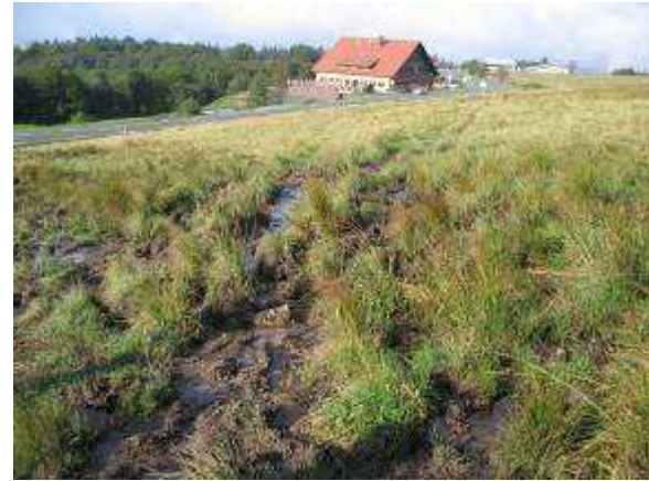
Photo 3 : Pédiculaire des marais et airelle rouge se développent dans un secteur moins piétiné par le bétail