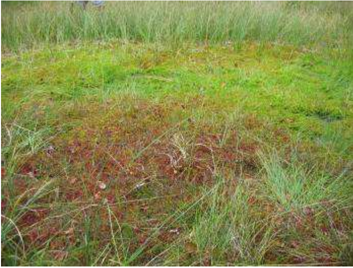
Photo 7 : Mare en cours de comblement, couverte de sphaignes à la pousse active, tourbière du Grand Rossely