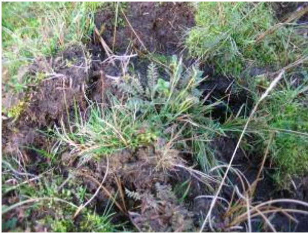
Photo 4 : près du secteur de la photo 2, résultats d'un carottage effectué par A. Laplace Dolonde : les 50 cm superficiels, composés d'une tourbe très détrempée, ont été extraits.