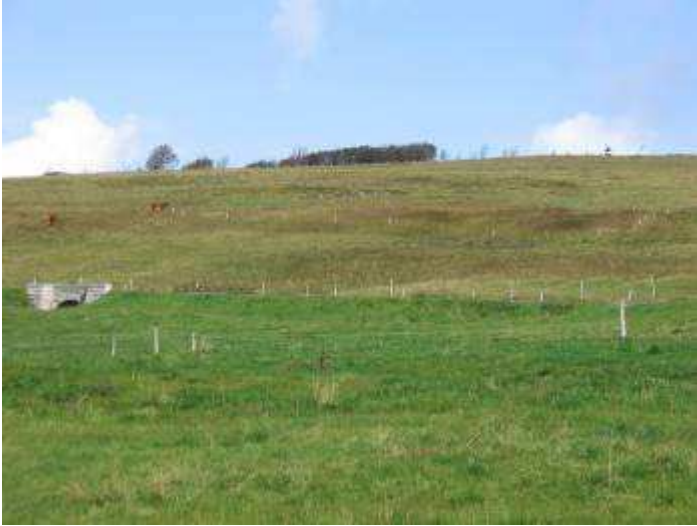
Photo 1 : vue générale du secteur de la source de la Savoureuse, Ballon d'Alsace