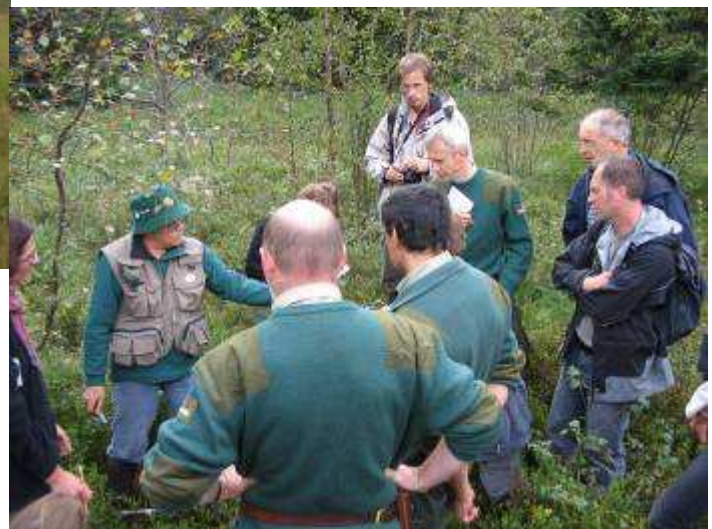
Photo 6 : une réflexion sur le passé (grâce au sondage) et l'avenir de la zone colonisée par les bouleaux