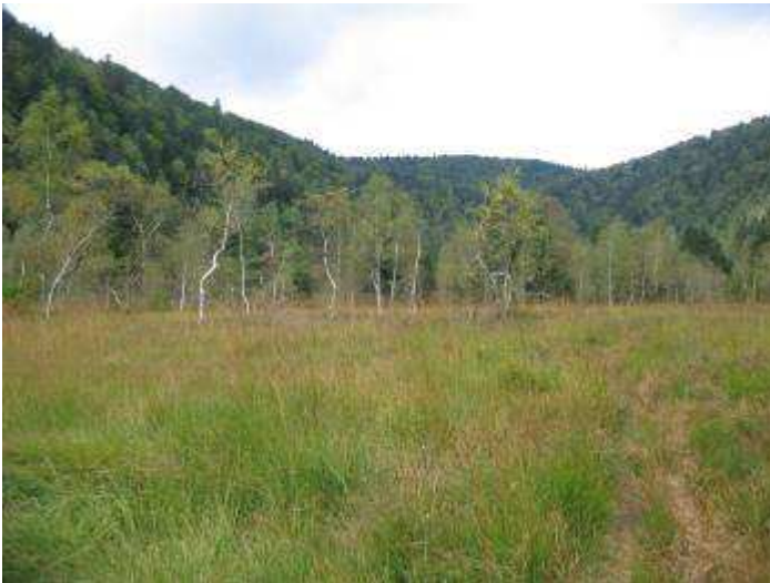
Photo 5 : tourbière du Grand Rossely : vue partielle de la moliniaie à bouleaux à l'entrée aval. de la tourbière