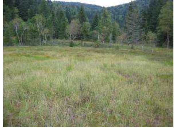
Photos 8 et 9 : vues de la partie amont de la tourbière du Grand Rossely. Certains éléments en creux du relief demandent à être expliqués (exploitation ancienne ?) Des bordures de la zone tourbeuse, relativement escarpées, voient se développer l'airelle des tourbières ainsi que de jeunes épicéas et bouleaux.