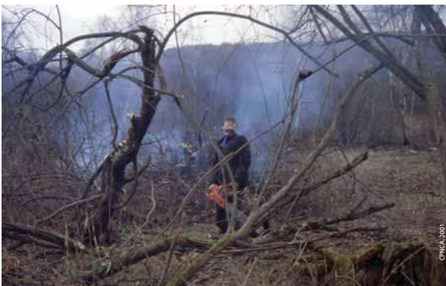
Elimination des ligneux lors d'un chantier de jeunes par la LPO Champagne-Ardenne en 2001

Actuellement, la gesse des marais ( Lathyrus palustris ), la laïche paradoxale ( Carex appropinquata ) et la fougère des marais ( Thelypteris palustris ) paraissent se maintenir mais pour une durée inconnue. Une étude hydraulique est souhaitable pour mieux comprendre les modalités de