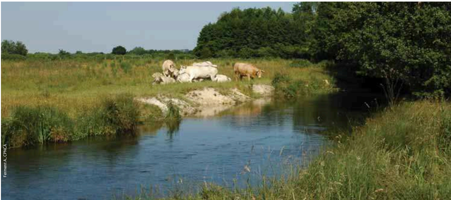
Vaches charolaises en pâture sur la tourbière alcaline

dégradation de la valeur écologique du site avec disparition d'espèces.