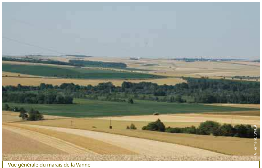
Vue générale du marais de la Vanne