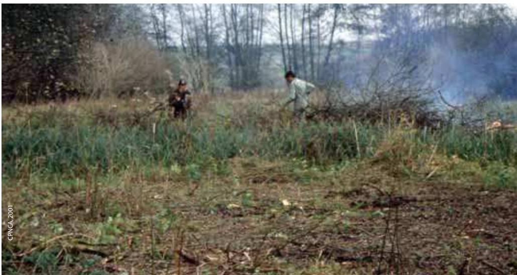
Opérations de débroussaillage par la LPO Champagne-Ardenne en 2001