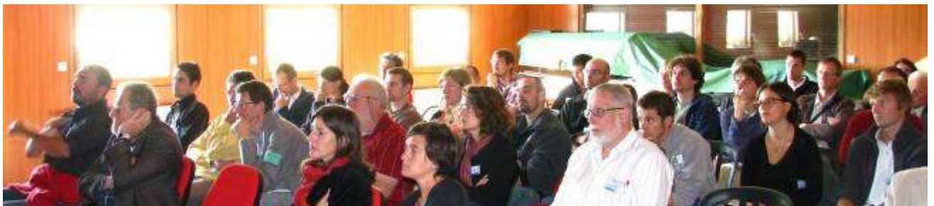
Les participants au colloque dans l'Aisne.

Le Pôle-relais Tourbières a préparé (recherche d'intervenants, préparation de contribution, examen des propositions de communications...) puis contribué à la réalisation effective les 22-24 septembre d'un colloque co-organisé par ADREE, le CREN Picardie, le GET, près de Laon [02]. Ce colloque qui a réuni 65 personnes avait plusieurs thèmes, tournant principalement autour des tourbières alluviales . Il faisait en cela écho aux rencontres et à l'édition du guide de gestion pour ces tourbières, qui s'étaient déroulés en 2005-2007.