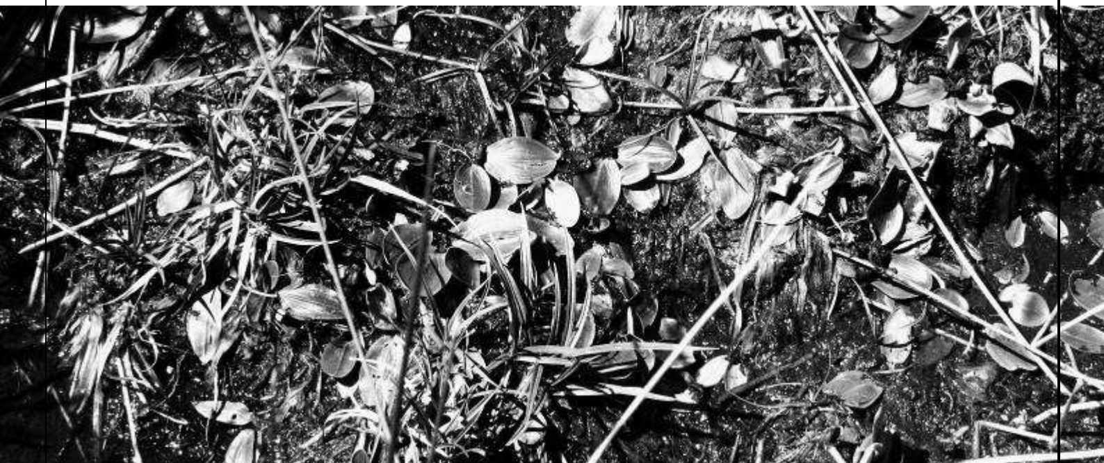
Dans la tourbière de Bagliettu, Moltifao [2B]

Voir également le site internet du Pôle-relais Tourbières www.pole-tourbieres.org pour les éléments cités dans ce rapport et tous les autres documents qui y sont consultables