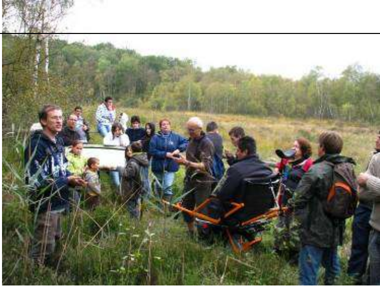
Visite guidée à la tourbière de la Grande Pile, St Germain [70]