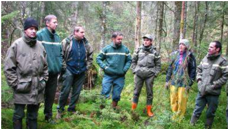
Journée technique avec les forestiers comtois près du Russey [25].

Il a été annulé par manque de participants. Mais le Pôle-relais Tourbières a préparé et encadré une journée régionale de formation destinée aux forestiers comtois (Doubs et Jura), qui s'est déroulée en mai 2010 aux environs du Russey [25], avec la contribution de la Communauté de communes Frasne-Drugeon. Le sujet principal abordé était de voir comment on pouvait avoir une préservation effective de tourbière dans des forêts qui ne faisaient l'objet d'aucune mesure de protection ou classement particulière.