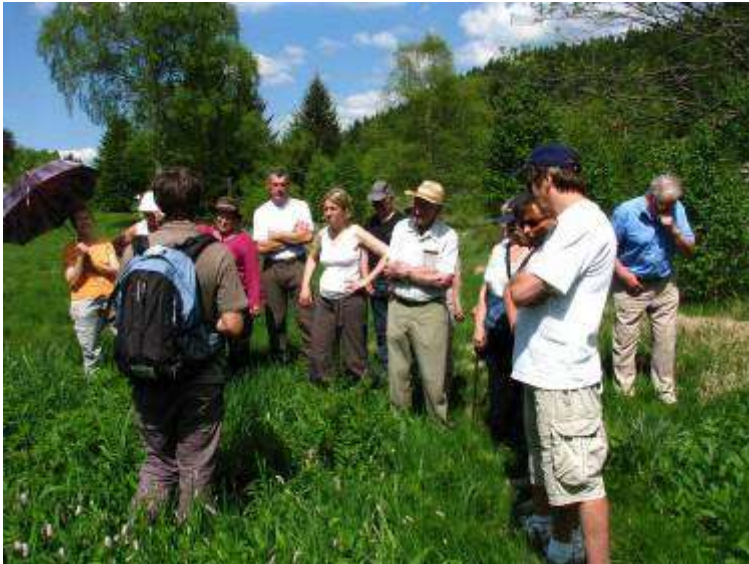
Visite guidée sur le site du Grand Etang de Gérardmer ; photo F. Muller, juin 2010.