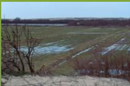
Marais littoraux de l'ouest : prairies inondables du Marquenterre [Somme]

Ils agissent sur les autres grands types de zones humides de France