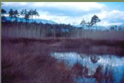
Lagunes méditerranéennes : marais de Cattolica, en forêt de Pinia [Corse du Sud]

Un pôle-relais commun aux : Zones humides intérieures... rives du lac du Der [Marne]