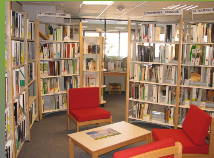
Centre de documentation

Un site internet : www.pole.tourbieres.org , destiné à diverses catégories de publics, apporte de nombreux renseignements et illustrations