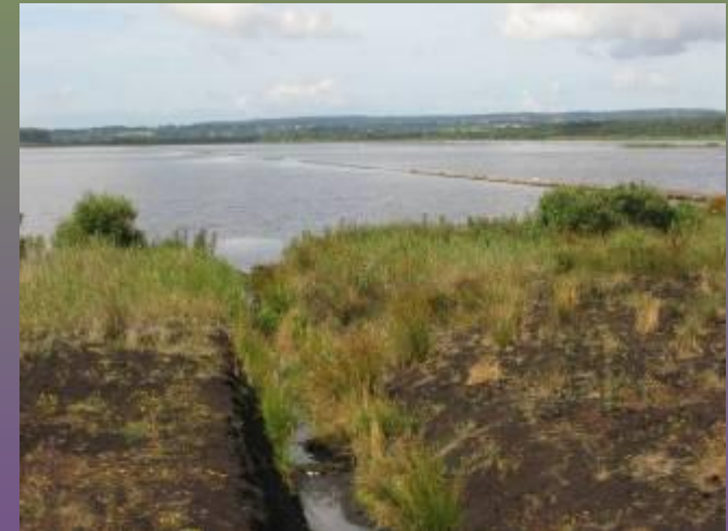
Baupte [Manche], une tourbière exploitée dont il faut réfléchir à l'avenir

Travail avec les syndicats de producteurs de terreaux; colloque en octobre 2007 sur la réhabilitation des tourbières et sur les terreaux