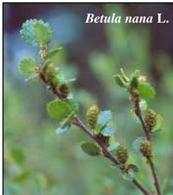
Betula nana L.