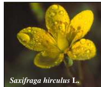
Saxifraga hirculus L.

Cette renommée attira, en Franche-Comté, les botanistes éminents de la Société botanique de France dans ses sessions extraordinaires de 1869 et 1919. Les comptes-rendus de ces herborisations sont particulièrement précieux aujourd'hui car ils sont, avec les herbiers, les seuls témoins de la richesse passée de ces milieux : ainsi, la saxifrage œil de bouc ( Saxifraga hirculus L.), la minuartie raide [ Minuartia stricta (Swartz) Hiern], l'agrostide fluette [ Agrostis agrostiflora (G.Beck) Rauschert], signalées autrefois dans le secteur de Pontarlier ont très certainement disparu du fait des agressions anthropiques (drainages, exploitation de la tourbe ou de graviers, comblement, collecte).